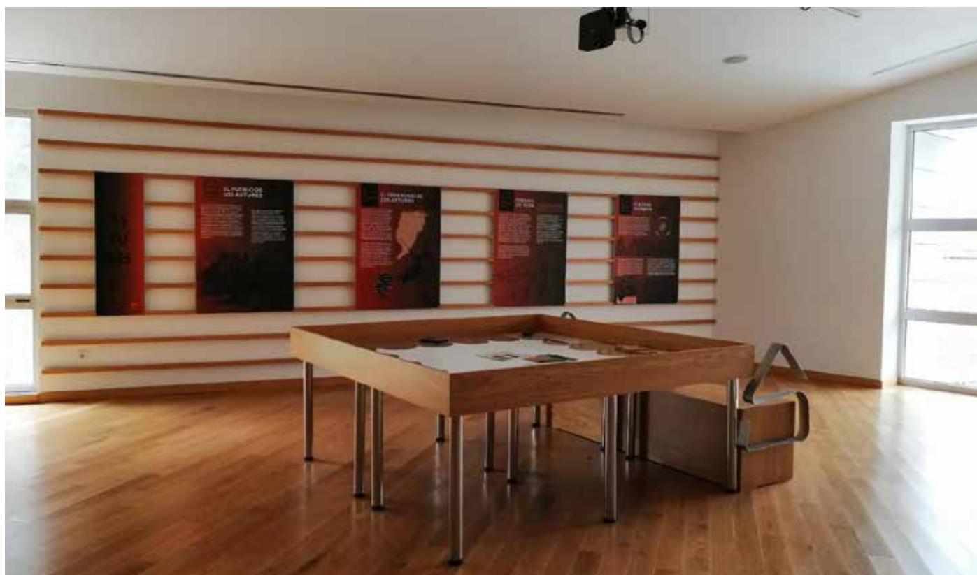
Interior del centro con material perteneciente a la época de Aula de Interpretación.

Creemos que los objetivos y las metodologías están en sintonía con los objetivos de la Agenda 2030 comprometiéndonos con la igualdad entre las personas, la protección del planeta y asegurando la prosperidad.